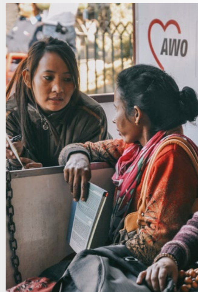
Beratungsstelle von AWO International am zentralen Busbahnhof von Kathmandu.

„Gemeinsam mit unseren Partnerorganisationen konnten wir nach den katastrophalen Erdbeben vom 25. April und 12. Mai 2015 etwa 50.000 Menschen helfen, mehr als 7.500 Übergangsunterkünfte aufbauen“, heißt es bei AWO International. „In sieben Dörfern um das Kathmandu-Tal wurden Betroffene durch unsere Partner psychosozial betreut.“